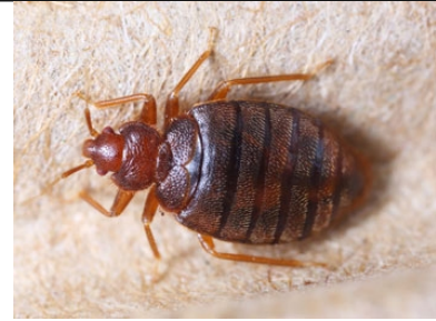
Photo d'une punaise de lit d'âge adulte

contact@laboratoire-klystal.com ou www.laboratoire-klystal.ca